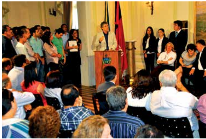
Governador Ricardo Coutinho destacou investimentos na educação

O vice-governador Rômulo Gouveia, por sua vez, destacou a implantação de mudanças na forma de administrar o Estado a partir de 2011, citando entre as ações o Pacto Social, "que trata com respeito e dignidade os prefeitos". Já o deputado federal Efraim Filho declarou que aplicar recursos na educação é o maior investimento que um governo pode fazer no seu povo, adiantando que "um Estado crescer econo-