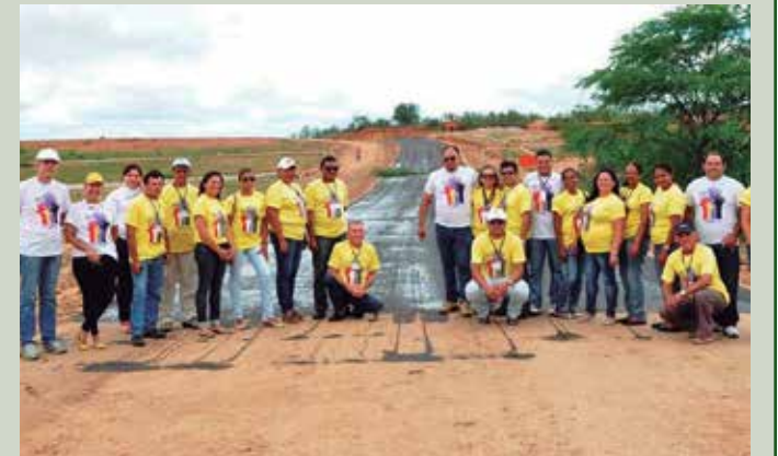
Conselheiros também fiscalizam obras projetadas pelo OD