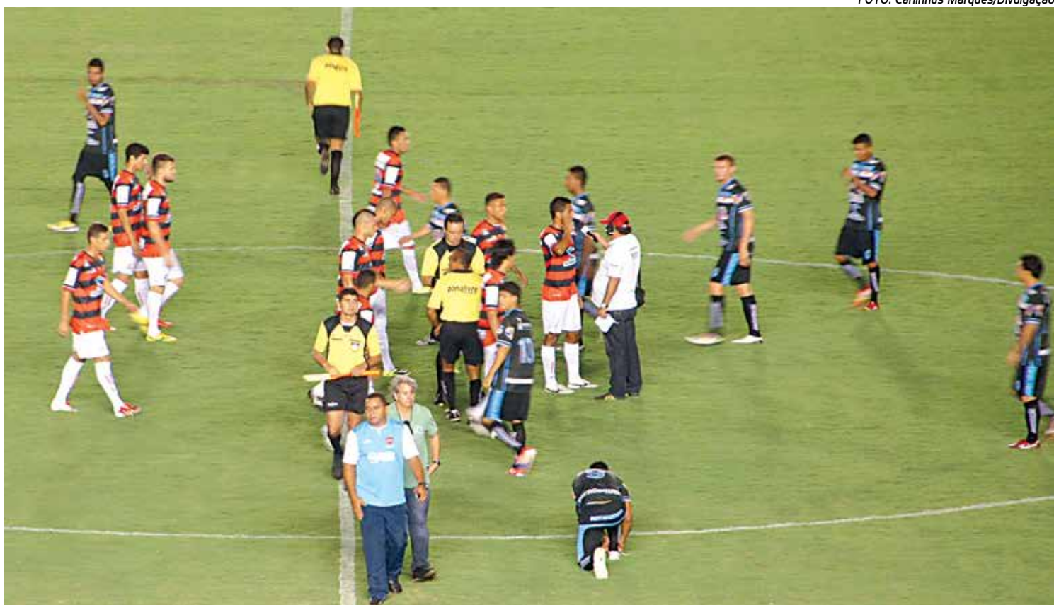
O empate entre CSP e Campinense, no Almeidão, favoreceu o Sousa que se manteve na liderança do Campeonato Paraibano 2014

Auto Esporte ainda está na briga, embora esteja na quarta posição com 15 pontos, mas com um jogo a menos