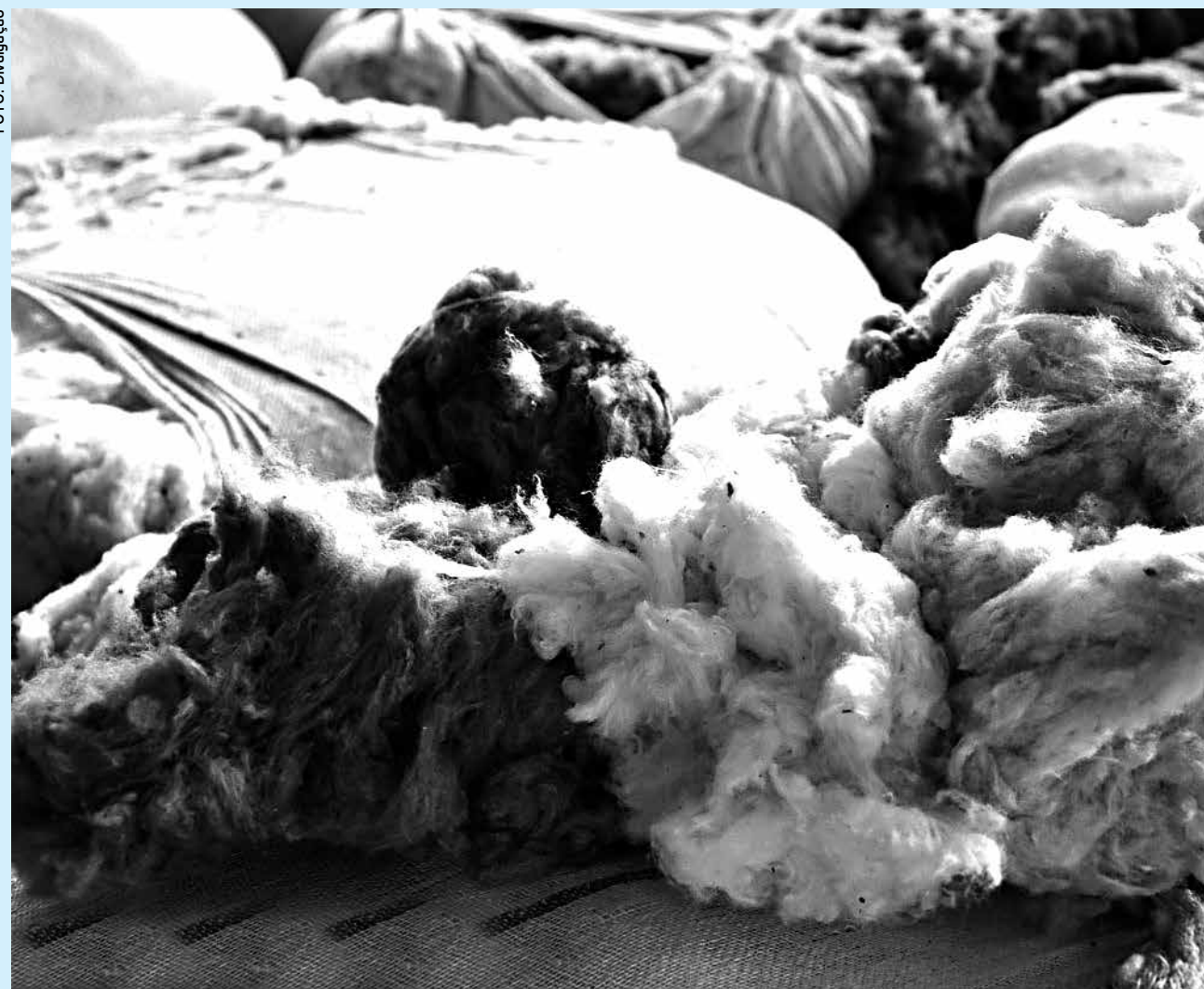
Projeto começa com 57 produtores inscritos e que vão utilizar uma área de 54 hectares com o algodão orgânico

Para revitalizar a cultura do algodão orgânico no Sertão, o Governo do Estado, por meio da Emater Paraíba, regional de Sousa, está buscando parceria e já realizou uma reunião no Distrito de Irrigação das Várzeas de Sousa, com a participação de várias autoridades do setor público agrícola, bem como com 93 produtores rurais para definição de uma programação para a produção em toda a região. O projeto começa com 57 produtores já inscritos e que vão utilizar uma área de 54 hectares com o algodão orgânico.