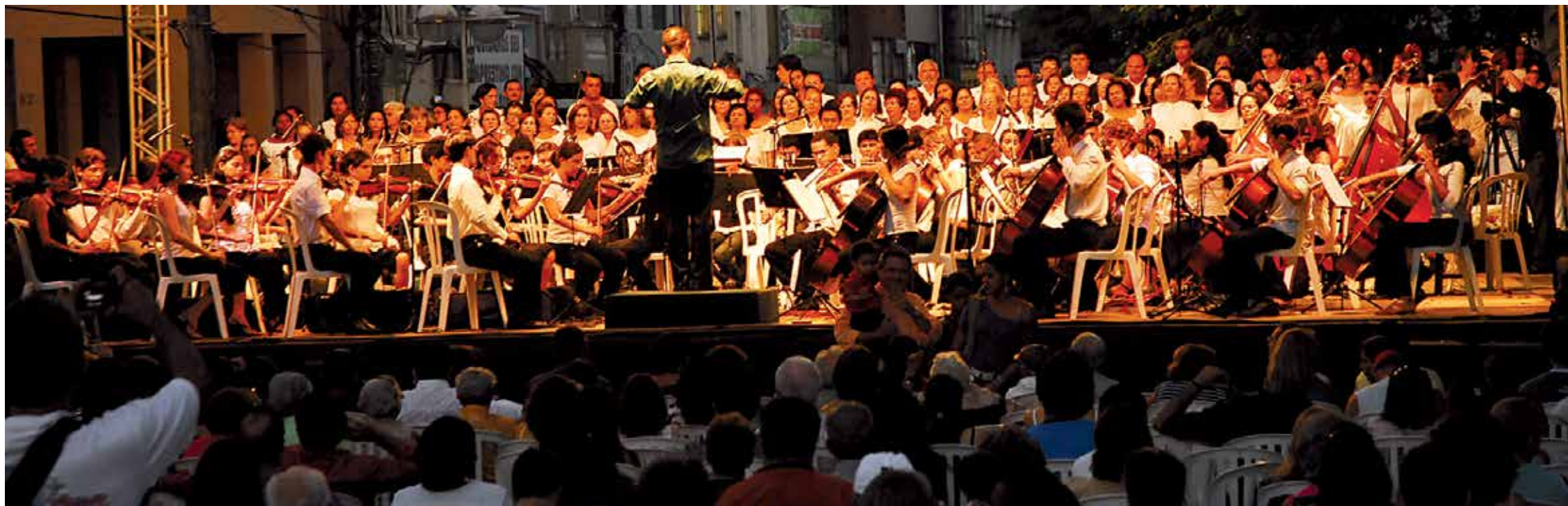
Os ensaios com a Orquestra Sinfônica Jovem da Paraíba, para os candidatos aprovados, terão início na próxima segunda-feira (24), no auditório da Escola Estadual IEP, na capital