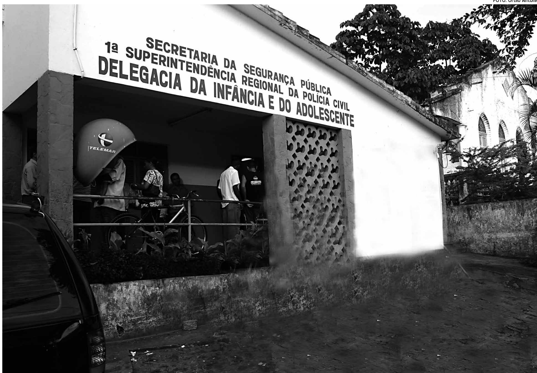
A Delegacia da Infância e do Adolescente é uma das especializadas que funcionam em regime de plantão, em João Pessoa. As distritais ficam abertas das 8h às 18h

João Pessoa e região contam com 13 delegacias distritais abertas de 8h às 18h para atendimento ao pú-