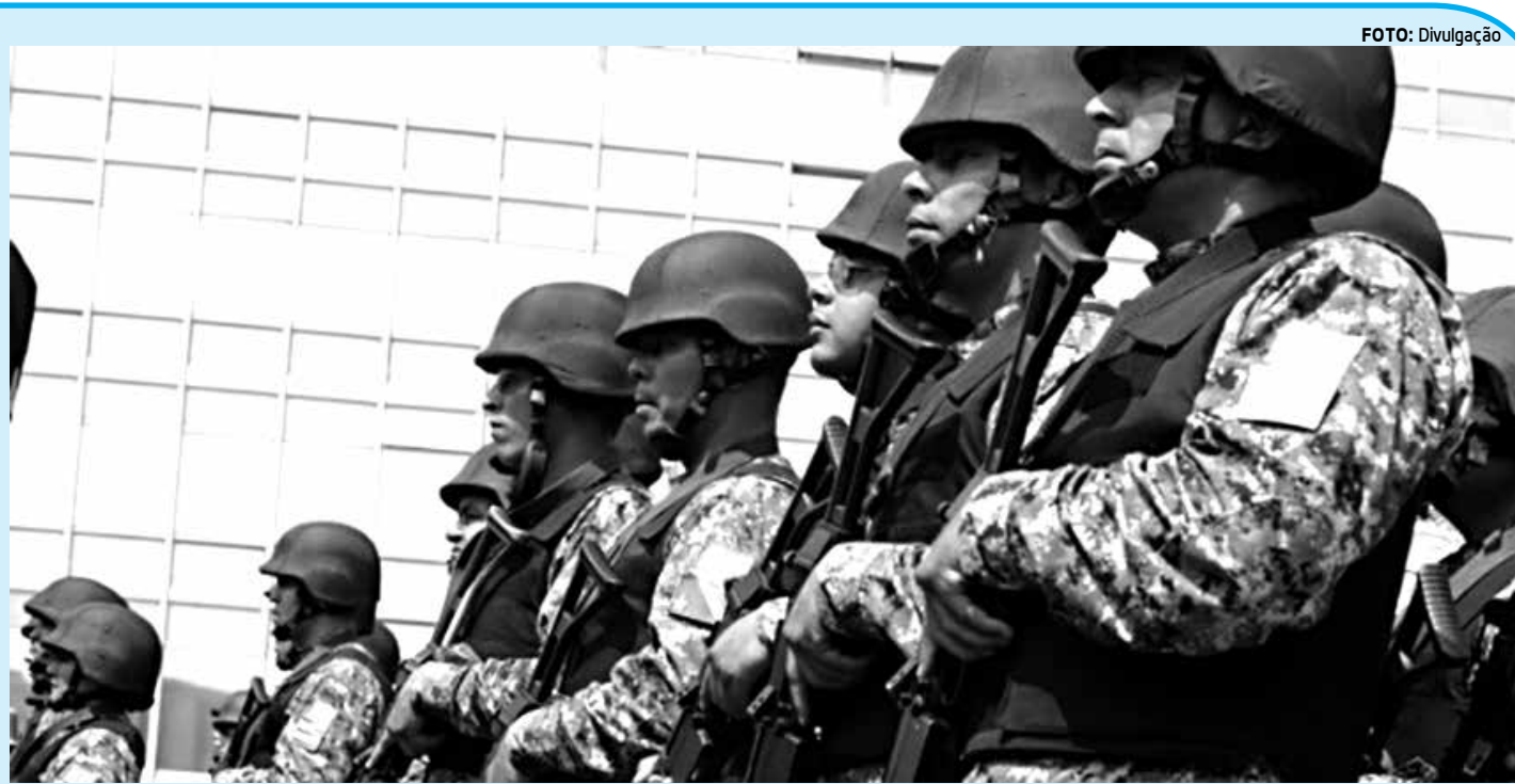
A Força Nacional de Segurança Pública vem atuando em Alagoas desde 2008. no apoio a uma série de operações no Estado

Se as pessoas abordadas tiverem estilingues, coquetéis molotov ou objetos usados para depredação, deverão ser levadas ao distrito policial.