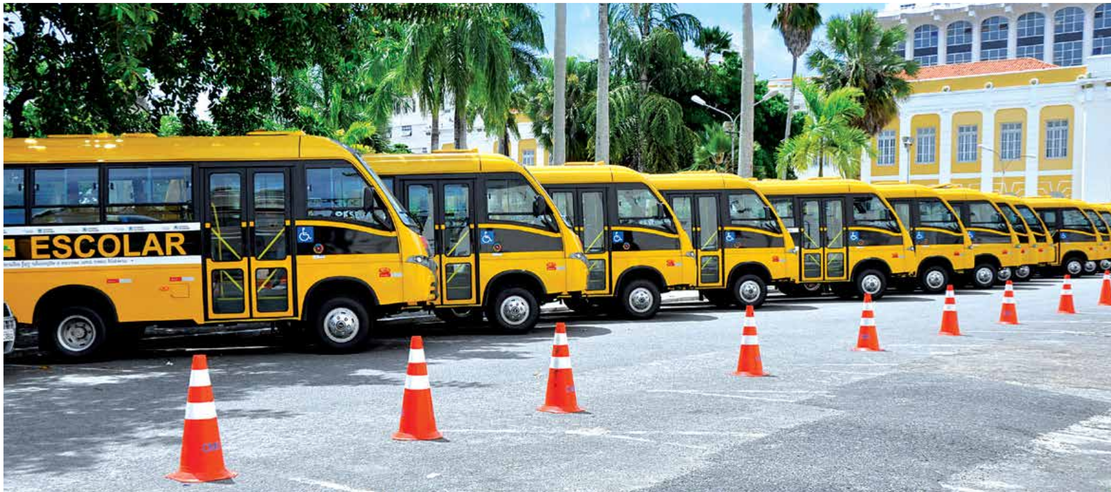
Governo do Estado entrega mais 162 ônibus escolares, beneficiando estudantes da zona rural paraibana PÁGINA 13